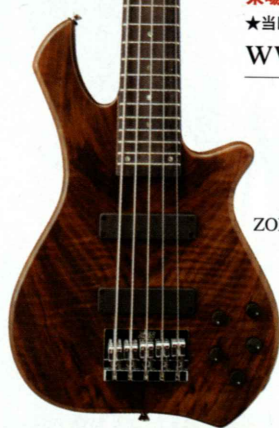
ZON Legacy Elite