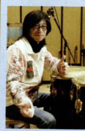
課題曲の作曲とプロデュースを行った:三沢またろう氏

優勝者には、ZON BASSをプレゼント! ★応募して頂いた方にももちろんプレゼント!!